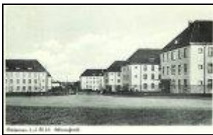
Kasernenansicht um 1938, südliches Tor Wildeshäuser Str.