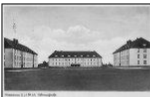
Exerzierplatz mit nördlichem Wirtschaftsgebäude (mitte) um 1937