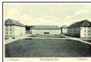
Exerzierplatz mit südlichem Wirtschaftsgebäude (mitte)

Zu Beginn des Oktobers 1942 gibt es wiederum diverse Veränderungen am Standort: Zum Einen wird der Stab des Infanterie-Ersatz-Regiments 269 nach Nienburg verlegt, zum Anderen erfolgt die Teilung des Infanterie-Ersatz-Bataillons 65 in ein Ersatz- und ein Ausbildungsbataillon, beide Einheiten bleiben am Standort. Außerdem werden aus Bremen durch Teilung des Fla-Ersatz-Bataillons 52 das Fla-Ersatz-Bataillon 52 sowie das Fla-Ausbildungs-Bataillon 52 nach Delmenhorst verlegt.