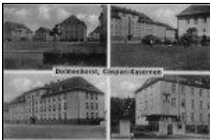
Verschiedene Kasernenansichten um 1940